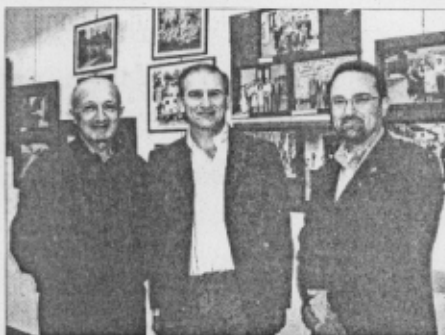
La mostra allestita dalla Società Operaia di Vesignano