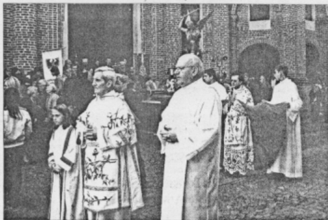
La statua di San Michele portata in spalla per le vie della città. Sotto, un momento della sfilata storica nel parco del castello Malgrà