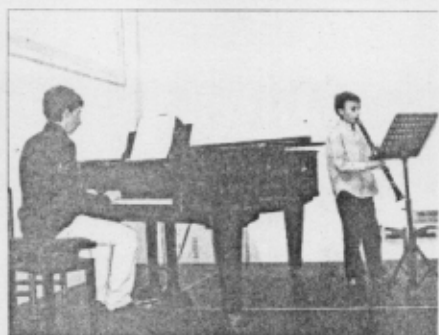
L'esibizione dei ragazzi del Liceo Musicale ha dato il via al fine settimana dedicato alla patronale